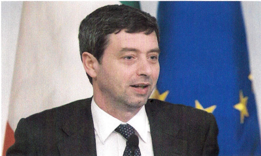
Il Ministro Guardasigilli Onorevole Andrea Orlando